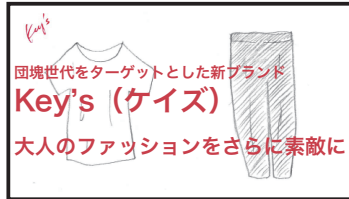
商品 -テロップ- 団塊世代をターゲットとした新ブランド Key's(ケイズ) 大人のファッションをさらに素敵に