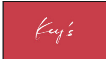
ロゴフェードイン