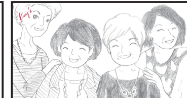
さあ、みなさん！ おしゃれの一步を踏み出しましょう -POINT- 視聴者に問いかけるような インタラクティブな見せ方