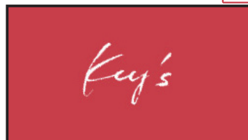
ロゴアニメーション