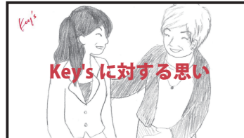
佐藤様接客風景などのイメージ映像