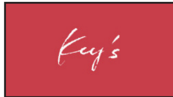
ロゴフェードイン